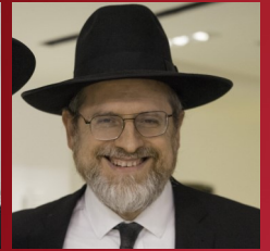
RABBI AKIVA TEICHTAL