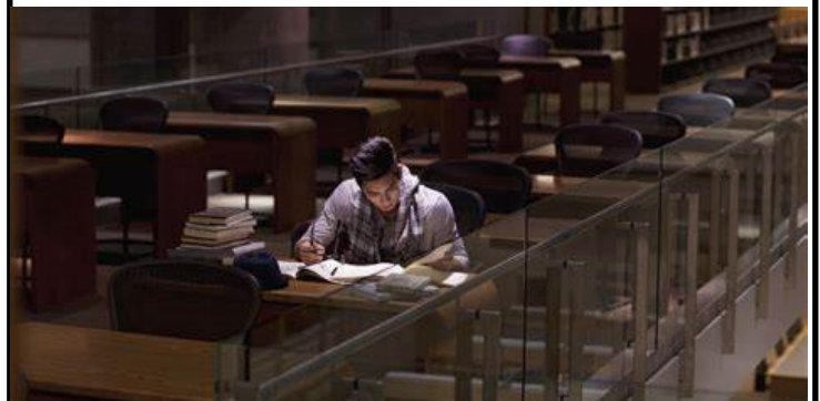
המשך בעמוד 3

יש גם גישות שונות ללמידה מתוך ספר. יש כאלה שלומדים את הנושא במהלך הסמסטר, לומדים כמומלץ ומצליחים במבחן הסופי. ויש אחרים שמבטלים את הזמן כל הסמסטר, וכמה ימים לפני