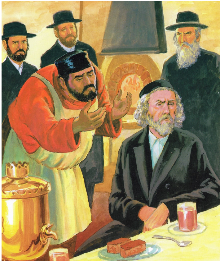
Illustration of the innkeeper and the Beis Halevi by Norman Nodel, as found in Maggid Stories for Children by Chaviva Krohn Pfeiffer.

All of us should work to do chesed , even when it is not comfortable. These particular acts of chesed outside of our comfort zones elevate us to greater heights and definitely deserve honorable mention.